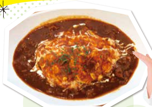
オムハヤシライス 400円