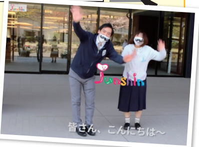
皆さん、こんにちは~

純真短大のアレコレを 広報スタッフがはりきって 動画でお伝えしています! ぜひ見に来てくださいね!