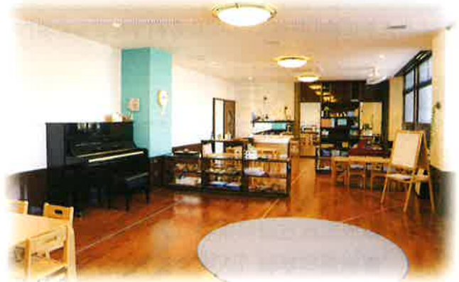
3・4・5歳児(そら・つき・さくら)保育室