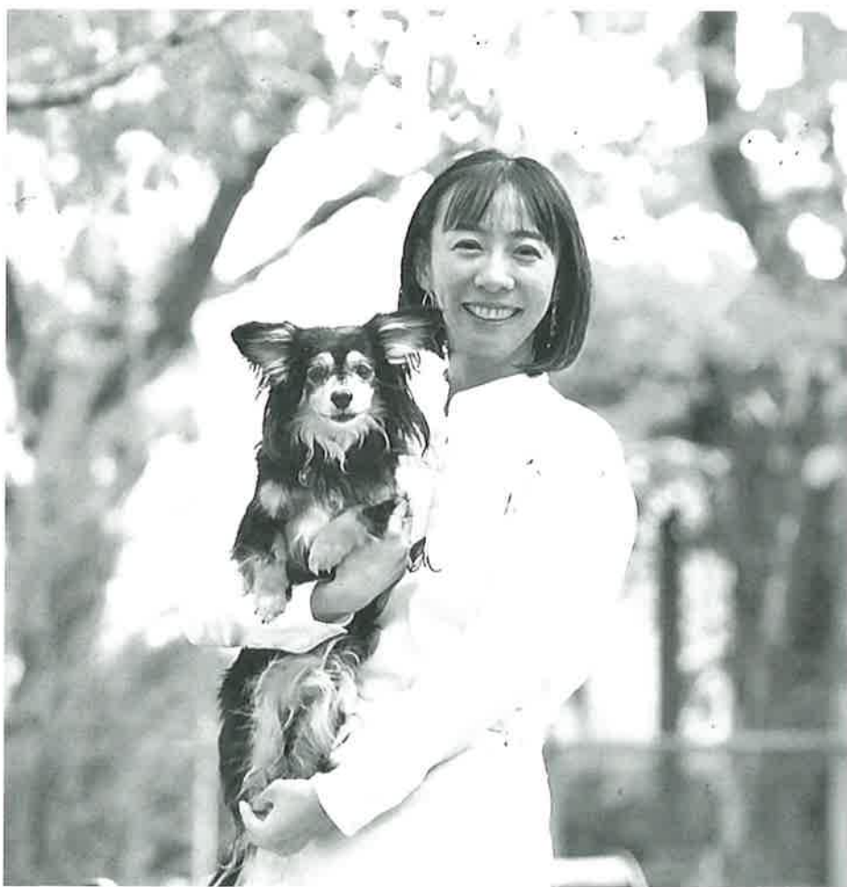
我が家で保護して家族の一員になった“コテツ”

「犬に関わる仕事に就きたい」「一生の仕事にしたい」と具体的に意識したのは高校3年の夏でした。それまでは大学に進学するのが当たり前だと思っていたのですが、将来のことを考えたとき「好きな事をして生きてい