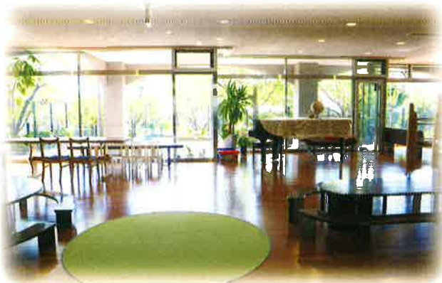
広々としたエントランス