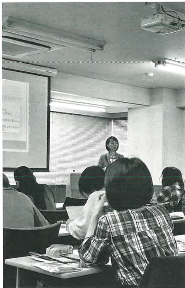
東京でのセミナーの様子

まで網羅している方は少なく、食事の指導も人間と同じ方法を犬に当てはめてしまつて問題が悪化…。それで、どうにかならないかとネットで検索して私の方に連絡が来るというところが多々あります。ちよつとだけ犬と人とのものの捉え方の違いさえ分かれば上手くいくのですが…。