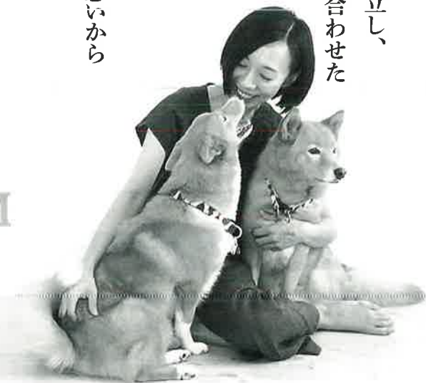
仕事のパートナー犬としてセミナー等でモデル犬をつとめる2頭の愛犬