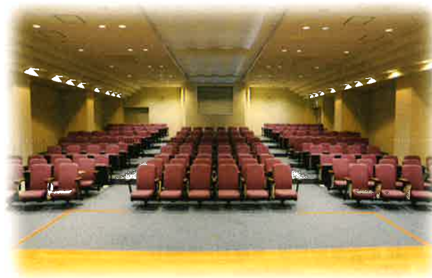
イベントが開けるホール