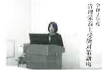
令和2年度 管理栄養士受験 対策講座