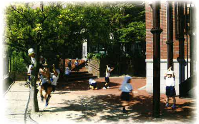
元気いっぱい遊ぶ園庭